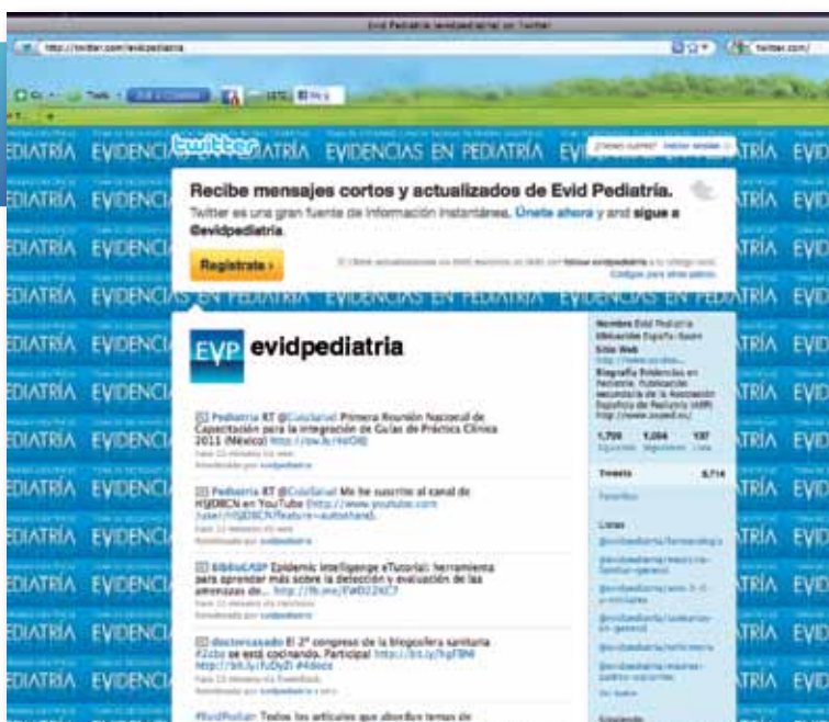
La Revista se subió al tren de las redes sociales el pasado año.

coordinadores de la revista, “a partir de un caso clínico surge una duda que es formulada en forma de pregunta clínica. Sobre dicha pregunta se efectúa una búsqueda bibliográfica para recuperar aquellos artículos que mejor puedan contestarla y posteriormente se aplican los nuevos conocimientos al escenario clínico que motivó la puesta en marcha de todo el proceso”.