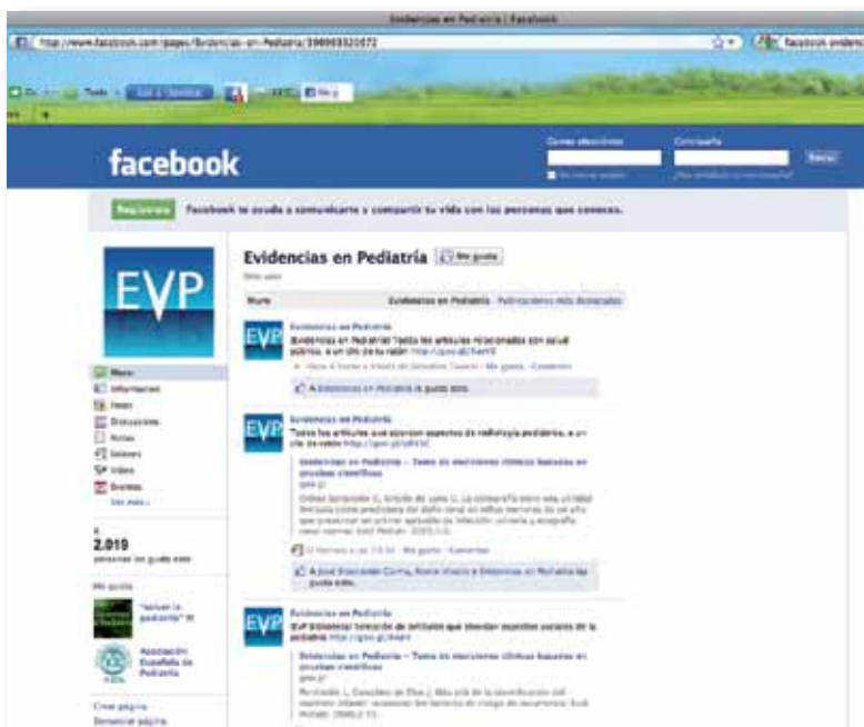
La página de Facebook cuenta con más de 2.000 seguidores y twitter con 1.390.

Por su parte, la sección “ Toma de decisiones clínicas: del artículo al paciente ” escenifica a partir de un caso clínico real, la puesta en marcha de todo el proceso MBE. Según explica el doctor Javier González de Dios , otro de los