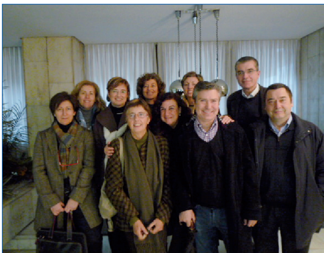
Figura 2. Algunos de los miembros del Grupo de Docencia de la AEPap. Febrero 2010

tuación práctica a los pediatras que tienen a su cargo la formación de residentes y que quieran actualizar su formación como docentes (figura 3).