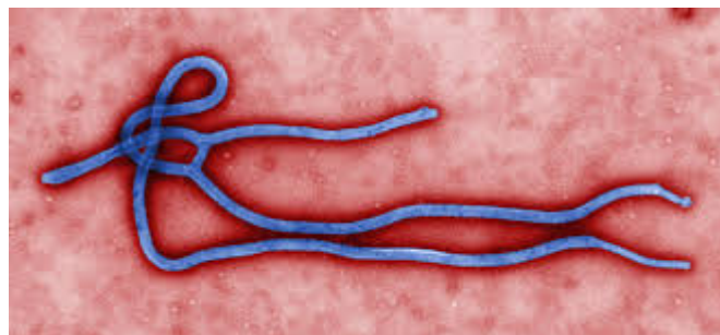
Imagen del virus.

La enfermedad por el virus del Ébola (EVE), anteriormente conocida como Fiebre hemorrágica del Ébola, está causada por un virus de la familia Filoviridae (filovirus) y comprende cinco cepas distintas. Tiene una letalidad muy alta que puede llegar hasta el 90%.